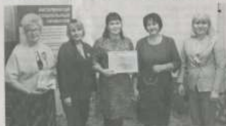
На базе реабилитационного центра для несовершеннолетних «Солнышко» в декабре прошел конкурс «Лучший социальный проект» среди сотрудников, участвующих в программе «Акселератор социальных проектов».